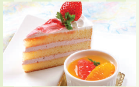
ショートケーキ & プチ杏仁豆腐