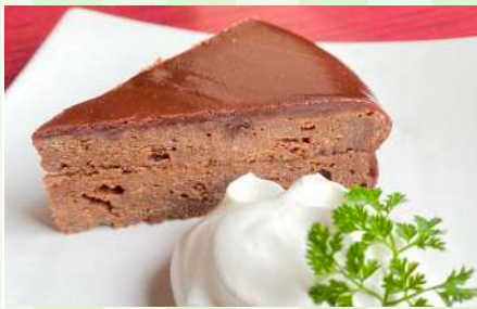
ザッハトルテ風チョコケーキ