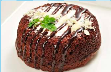
生ガトーショコラ